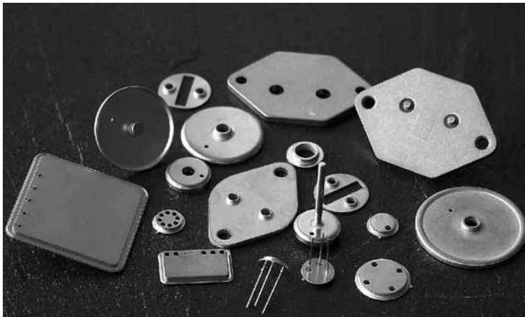
Kunden schätzen den kompromisslosen Qualitätsanspruch sowie die kurzen Lieferzeiten und die hohe Liefertreue des Unternehmens

Wir wollen unsere Fertigungstiefe in den nächsten Jahren noch weiter ausbauen.“